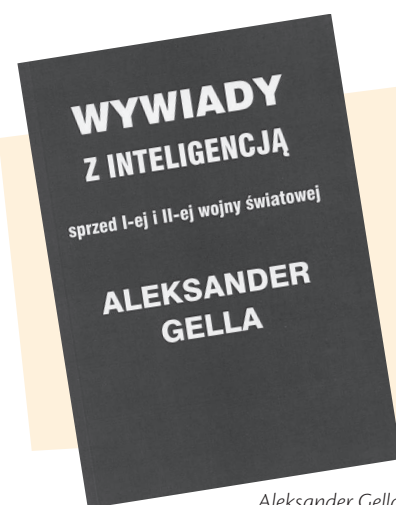
Aleksander Gella Wywiady z inteligencją Sprzed I-szej i II-ej wojny światowej Warszawa : „AKME”, 2015 200 S. ; 21 CM

Książka zawiera osiemnaście wywiadów z przedstawicielami najstarszego pokolenia inteligencji emigracyjnej. Ludźmi, którzy weszli w życie jeszcze przed pierwszą wojną. Sam autor nie zdążył już tych rozmów całkowicie opracować. Trafiają zatem do rąk czytelnika w swej oryginalnej postaci.