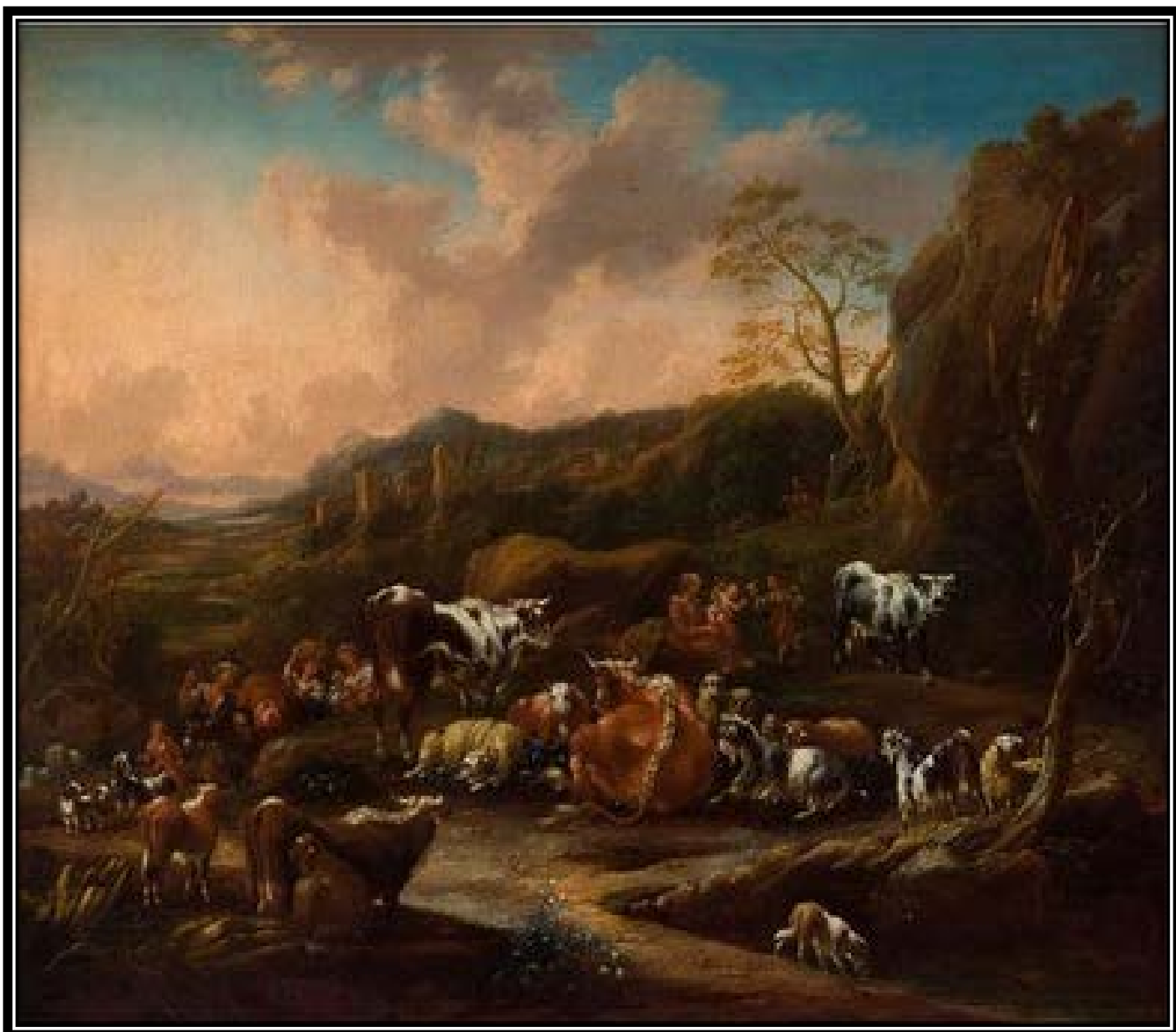
Zdj. 1. Matthias Wuzer, „Pejzaż z pasterzami, bydłem i kozami”- jeden z obrazów upiększających siedzibę Polskiego Towarzystwa Ekonomicznego przy ul. Nowy Świat 49.